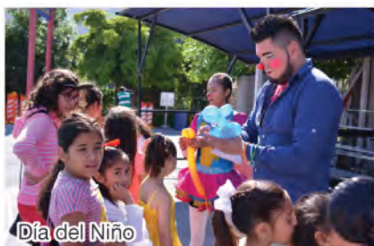
Día del Niño