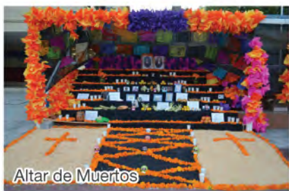
Altar de Muertos