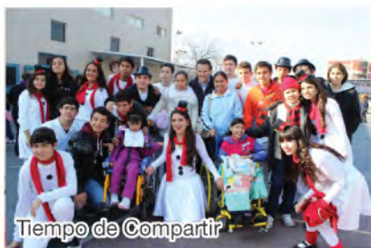
Tiempo de Compartir